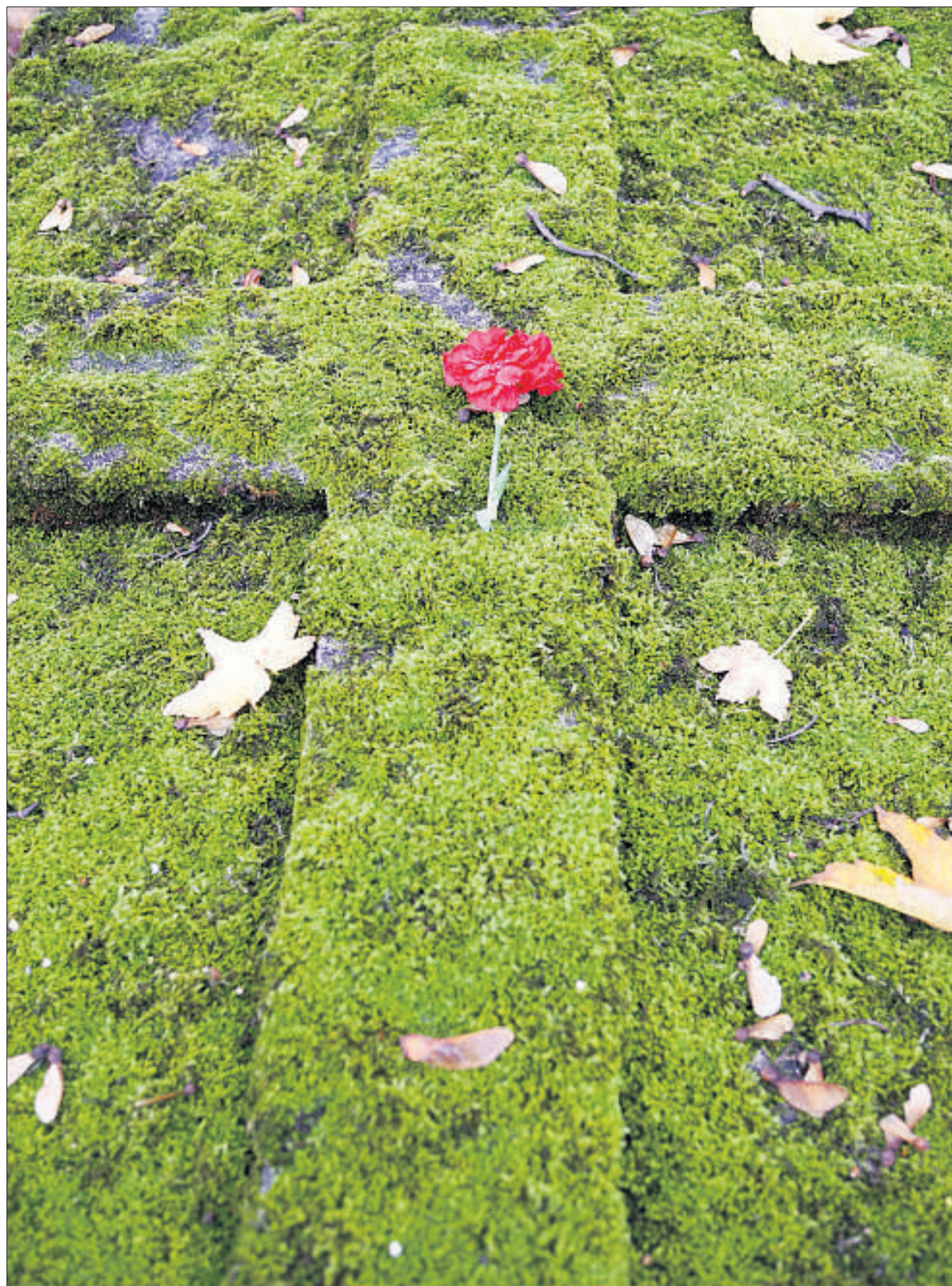
Viele Todkranke sprechen davon, rasch ins Grab kommen zu wollen. Doch zeigen Sterbewünsche sich oft als unbeständig.